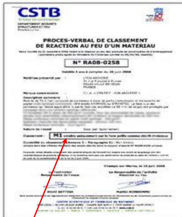
Exemple INDICE DE REACTION (M1)